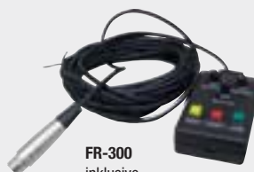
FR-300 inklusive Controller