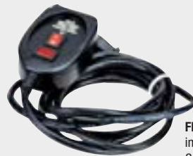
FR-100 inklusive Controller